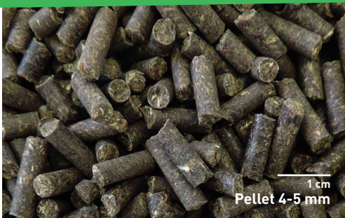
Futterabbildung im Originalmassstab Farben können vom Produkt abweichen